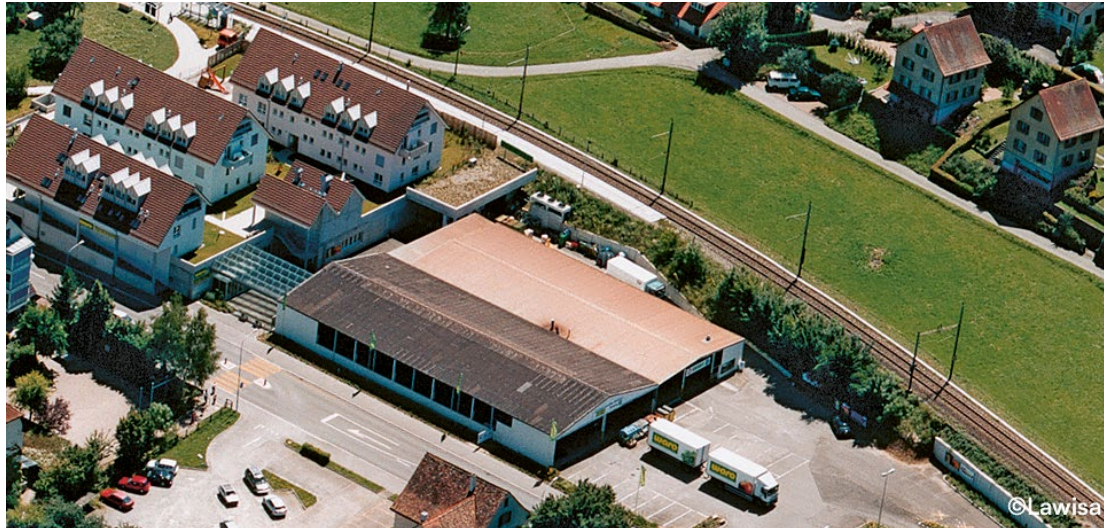
Langwiesen «im Dorf» 2015.